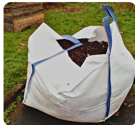
© Retour d'expérience d'élèves de La Baugerie

Les élèves ont donc passé 3 après-midis au jardin pour définir les zones de culture, arracher les mauvaises herbes, aérer la terre à la grelinette, enrichir de compost et enfin pailler chaque zone sous une météo parfois capricieuse. Ils ont fait preuve de volonté et d'abnégation pour braver froid et pluie, Bravo pour ce projet !